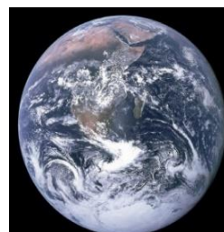
Aufnahme der Erde aus dem Weltall