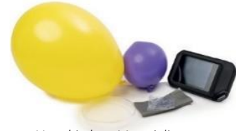
Verschiedene Materialien zur Erforschung der IR-Strahlung