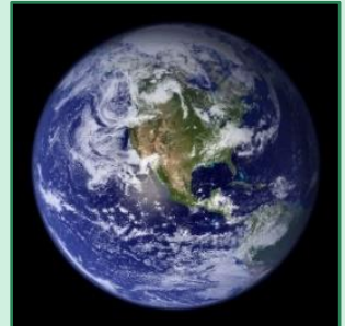
Nuestra Tierra azul

Aproximadamente dos tercios de la superficie de la Tierra están cubiertos por agua líquida, lo cual tiene un impacto en el clima de la Tierra. Esto se debe a que el agua es un almacén de calor muy eficaz: una cierta masa de agua puede absorber significativamente más energía por cada kelvin de aumento de temperatura que la misma masa de aire, o de tierra. Por ejemplo, un kilogramo de agua se calienta con un suministro de energía de 4,2 kJ por cada kelvin que incrementa su temperatura. Por lo tanto, el agua tiene una capacidad calorífica de 4,2 kJ/(kg·K). El aire y la tierra seca, en cambio, tienen una capacidad calorífica de aproximadamente 1 kJ/(kg·K). Por lo tanto, alrededor de un kilojulio es suficiente para calentar un kilogramo de estas sustancias en 1 K. El efecto invernadero provocado por el ser humano aporta energía adicional a la superficie terrestre. ¿Cómo afecta el agua de los océanos al calentamiento global?