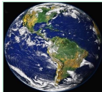
La perla azul