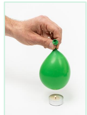
Globo lleno de agua sobre la vela