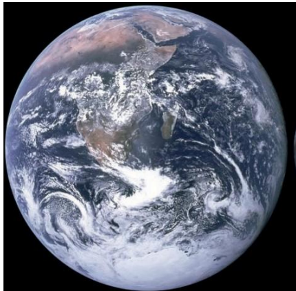
Die Erde

a) Was macht die Erde für dich besonders. Notiere deine Ideen. Du kannst auch zeichnen