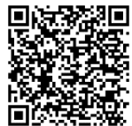
Video zum Versuch