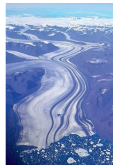
Gletscher auf Grönland

Landeis: z. B. Gletscher, die auf dem Land liegen