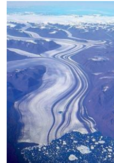
2: Gletscher auf Grönland

Meereis bildet sich aus Meerwasser, wenn die Temperatur des Wassers unter 0°C fällt. Meist schmilzt es im Sommer und bildet sich im Winter wieder neu. Eisberge entstehen aus großen Stücken Eis, die im Meer schwimmen. Der größte Teil des Eisberges befindet sich unter Wasser. Eisschollen bilden sich im Meer und sind meistens nur zwischen drei und sechs Meter groß.